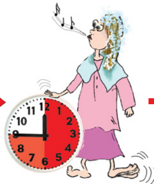
meistens 30 - 45 Minuten Einwirkzeit (unbedingt Packungsbeilage genau beachten)