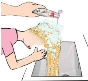
Haare mit der Lösung durchtränken