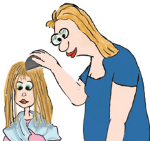
Die nassen Haare am 1., 5., 9. und 13. Tag auskämmen.